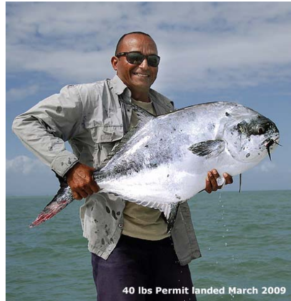
40 lbs Permit landed March 2009

Es werden 8 Boote verfügbar sein. Vier der Boote sind Hewes Bonefisher 17 mit 75 PS und 90Ps (die wir in Cayo Largo hatten) und vier brandneue Carolina Skiff Sea Chaser mit 60 PS. Sie sind ausgerüstet für das Fliegenfischen und Spinnfischen, mit Kühlschrank, Rettungswesten, Erste Hilfe Ausrüstung und Radios. Die meisten Fliegenfischer Guides sind die gleichen, die mit Fabrizio in Casa Batida auf Cayo Largo gearbeitet haben mit langer Erfahrung im Fliegenfischen.