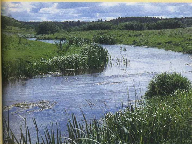
Die Brede Au - nahe der deutsch/dänischen Grenze - wurde wieder in ihr altes Flußbett zurückverlegt.