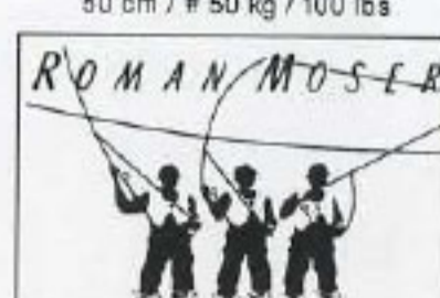
NYMPH N° 4 EXTRA-FAST-SINKING 9 ft / # 0,16 mm / 2,5 kg / 5 lbs