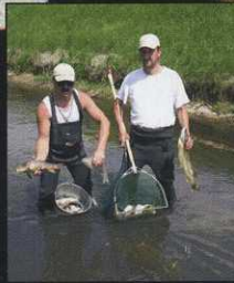
ARA-Ausfall führte zu Fischsterben im Koblacher Kanal bei Hohenems (S. 11)