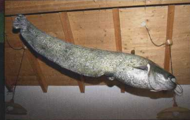
Prächtiges Präparat des Riesenwelses Attraktion im Emser Fischerheim (S. 6 und 7)

Sponsoring-Post Verlagspostamt Hard, Vorarlberg, Zul.Nr. 02Z030148