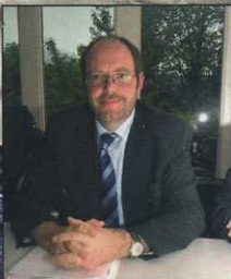
Bilanz des Verbandes für 2005: Fischerei im Ländle auf gutem Weg (S. 3 bis 5)

Sponsoring-Post Verlagspostamt Hard, Vorarlberg, Zul.Nr. 02Z030148