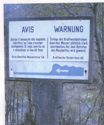
Warnung von Schwall am Vorderrhein – aber die Kreatur kann sich nicht ans Ufer retten.

Feuerstein berichtete auch von einem bedauerlichen Fischsterben am Binnenkanal auf Schweizer Seite, an dem Turbinen schuld waren. Zu Beginn der Äschensaison musste der kantonale Fischereiaufseher Fredi Fehr ausrücken. Beim untersten der drei Kraftwerke wurden Fischkadaver festgestellt. Für Fehr bestand kein Zweifel, sie waren durch die Turbinenflügel zerstückelt worden. Dasselbe unappetitliche Bild zeigte sich an den beiden oberliegenden Anlagen. Vermutlich hatten die Forellen wegen des niedrigen Wasserstandes den Weg durch die Einlaufgitter statt über das Wehr gefunden. Zumal es sich um eine erstmalige Erscheinung handelte, ist Aufseher Fehr um eine Klärung der Ursache und technische Abhilfe bemüht.