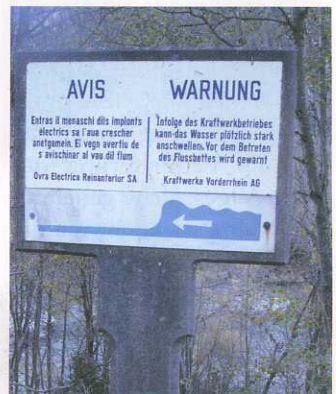
Warnung von Schwall am Vorherrhein – aber die Kreatur kann sich nicht ans Ufer retten.

Feuerstein berichtete auch von einem bedauerlichen Fischsterben am Binnenkanal auf Schweizer Seite, an dem Turbinen schuld waren. Zu Beginn der Äschensaison musste der kantonale Fischereiaufseher Fredi Fehr ausrücken. Beim untersten der drei Kraftwerke wurden Fischkadaver festgestellt. Für Fehr bestand kein Zweifel, sie waren durch die Turbinenflügel zerstückelt worden. Dasselbe unappetitliche Bild zeigte sich an den beiden oberliegenden Anlagen. Vermutlich hatten die Forellen wegen des niedrigen Wasserstandes den Weg durch die Einlaufgitter statt über das Wehr gefunden. Zumal es sich um eine erstmalige Erscheinung handelte, ist Aufseher Fehr um eine Klärung der Ursache und technische Abhilfe bemüht.