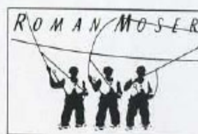
MINICON-SALMON # 17 kg / 34 lbs