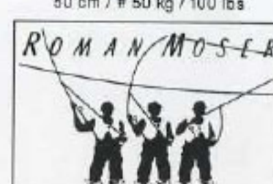
NYMPH N° 4 EXTRA-FAST-SINKING 9 ft / # 0,16 mm / 2,5 kg / 5 lbs